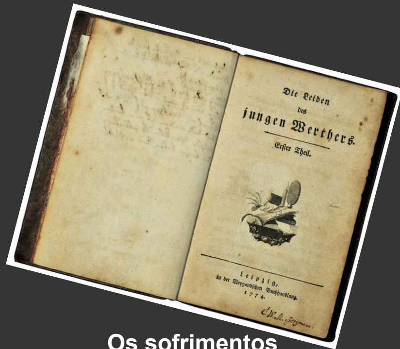
Os sofrimentos do jovem Werther(1774)